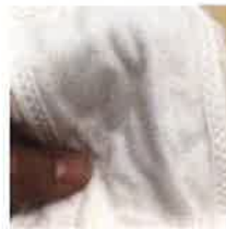
SAP不織布使用吸水パンツ

着替えの際も目立たない 身生地と同色の吸水パッド は、着用する皆さまから、大好評を得ております。