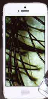
スマートフォンで閲覧