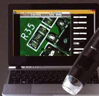
パソコン(ブラウザ経由)で閲覧